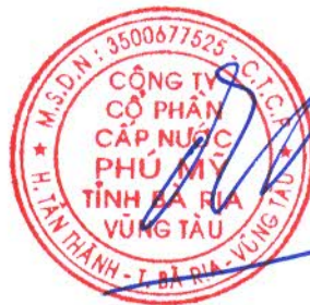
ĐINH CHÍ ĐỨC